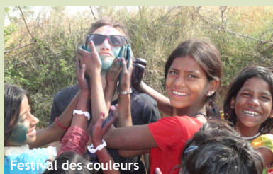
Festival des couleurs