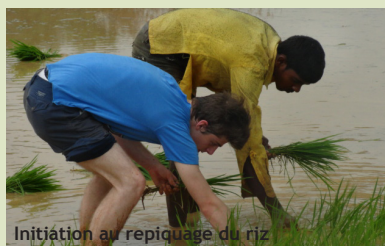
Initiation au repiquage du riz